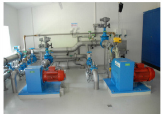
Abb. 3 Blick in den Turbinenraum.

Seit der Inbetriebnahme konnte ein weitgehend stabiler Betrieb hinsichtlich der Membran-Permeabilität und der online gemessenen Qualitätsparameter erreicht werden (Tab. 4). Einzig die UV-Entkeimung musste zu Beginn einmal gereinigt werden, da sich auf dem Quarzglas der Hüllrohre feine Partikel aus