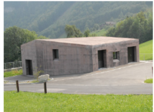
Abb. 2 Aussenansicht des neuen Reservoirs Schönegg.

Wie für andere Innerschweizer Wasserversorgungen am Alpennordhang sind auch für Hergiswil die im Bergsturzgebiet gelegenen Quellen wichtige Lieferanten eines mittelharten, chemisch meist einwandfreien, aber oft trüben Wassers. Der Gehängeschutt im Einzugsgebiet der Quellen «Renggeli», «Brunni», «Nestel», «Müsli» und «Rossmoos» fungiert als Hangwasserleiter, dessen Speisung durch die im Einzugsgebiet fallenden Niederschläge erfolgt. Ein gewisser Anteil des Hangwassers stammt aber auch aus Infiltrationen vom Mülibach. Die Schwankungsziffer der genannten Quellen erstaunt daher nicht (Mittel 2090 l/min; min. 800 l/min; max.